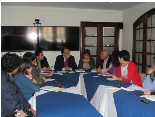
Bilera, Memoria Historikoaren Zentro Nazionalarekin (Bogota)

Erakunde publikoek uste dute 14/48 Legea bakea eraikitzeko orduan oinarriko aurrerapausoa dela nahiz eta onartzen duten hori ezartzeko orduan zenbait hutsune eta gabezia daudela.