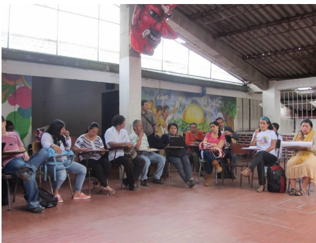
Bilera, Caucaoko Departamenduko giza eskubideen aldeko erakundeekin (Popayan)

Caucan, eskualdeko buruzagiak epaitzeko estrategia salatu dute erakundeek; diotenez, 906 Legea, zigor auzibidea arautzen duena, pobrezia eta salaketa soziala kriminalizatzeko eta epaitzeko sortu da, eta, gainera, ez du bermerik ematen akusatuen defentsarako. Erakundeari jakinarazi dizkiote auzibide horietan oinarri asko urratu izan direla; esaterako, irregulartasunak izan dira frogen zaintza-kateetan —zeinak militarren brigadetan egoten diren— eta lekukoak erabileran —Polizia Nazionalak edo armadak berak dirua ematen die birgizarteratu diren FARC eta ELN taldeetako kideei eta gaizkile arruntak direnei, lekukotasun faltsuen truke—. Esan dute baita Brigada Militarretan ere egin dituztela zibilen auzialdiak, eta Fiskaltzak zilegitasuna eman diela horrelako jardunbideei.