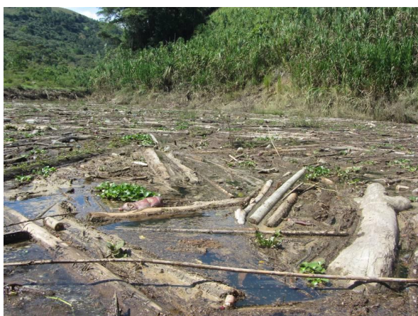
Urtegiaren buruko sedimentuak, Hondurasko Babeslekutik gertu

Hala, oinarrizko eskubideak urratzen dira, eta, era berean, 1986ko aktako urratzen da. Komunitatea kezkatuta dago bereziki ez dutelako sarbiderik osasun (prebentzioak eta larrialdi medikoak) eta hezkuntza zerbitzuetara (Lomitas eskolara joateko bi ordu behar direnez eta bideak militarizatuta daudenez, gurasoek erabakitzen dute umeak eskolara ez bidaltzea) eta ezin dutelako aske mugitu beren lurraldean.