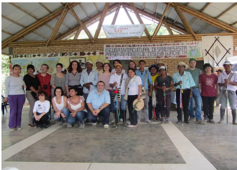
Euskal Ordezkaritza, buruzagi tradizionalekin, gobernadoreekin eta Hondurasko Babeslekuan eta Cerro Tijerasko Kabildoan dagoen komunitateko kideekin (Hondurasko Babeslekua, Morales, Cauca)

Hondurasko Babeslekua izaera bereziko lurralde-erakundea da, eta estatuak izaera koloniala aitortu zion leku hari 1956an. Cerro Tijerasko Kabildoan indigenen, nekazarien eta afrikar etorkikoen herriak daude. Bietan, nasa etnia zaharreko komunitate indigenak daude. Nasa herriak ez du bizitza ulertzen lurrik eta kolektibitate gabe.