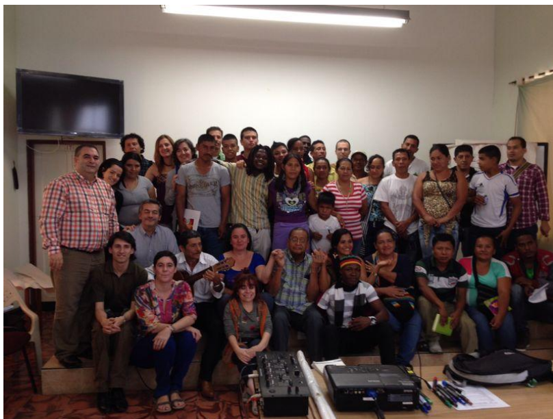
Euskal Ordezkaritza, Justiziaren eta Bakearen Aldeko Eliz Arteko Batzordekoekin eta laguntzen dituzten komunitateetako kideekin (Popayan, Cauca)

Justiziaren eta Bakearen Aldeko Eliz Arteko Batzordea (CIJP) giza eskubideak babesten dituen erakundea da. Gatazka armatuak dauden lekuetan, afrikar etorkiko, mestizo- eta indigena-komunitateen eta erakundeen prozesuetan laguntzen du, beren eskubideak indarkeriarik erabili gabe aldarrikatzen dituzten kasuetan. Horretaz gainera, babesa ematen die egiaren, justiziaren eta erreparazioaren bila ari direnei eta barne-gatazka armatuari irtenbide negoziatua eman nahi dietenei.