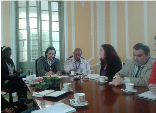
Bilera, Giza eskubideen eta Nazioarteko Zuzenbide Humanitarioaren programa presidentzialarekin (Bogota)

Giza Eskubideen eta Nazioarteko Zuzenbide Humanitarioaren programa presidentzialean esaten dute gobernuaren helburua bake integrala eraikitzea dela. 2011ko 4100 Dekretua onartzearekin batera, Giza Eskubideen Sistema Nazionala sortu zen, arauak, politikak, erakundeak eta nazio eta lurralde osoko eskariak eratzeko eta koordinatzeko, baita giza eskubideen errespetua eta bermea bultzatzeko eta Nazioarteko Zuzenbide Humanitarioa (NZH) aplikatzeko ere.