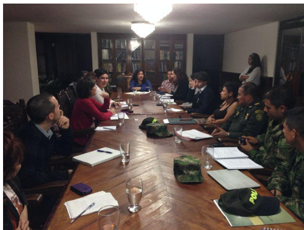
Bilera, Caucako departamenduko agintari zibil eta militarrekin (Popayan)

Honako hau jakinarazi digu Gobernurako eta Kudeaketa eta Partaidetza Sozialerako Idazkaritzak Caucako Gobernazioaren Giza eskubideen eta nazioarteko zuzenbide humanitarioaren programaren barruan: Alerta Goiztiarren Sistemaren arabera (SAT), departamenduko udalerrien %50ek arrisku-txostena dutela, giza eskubideekiko eta NZHrekiko arau-urratzeak egiteagatik. Defentsa Bulegoak igortzen ditu txosten horiek, eta hura arduratzen da jarraipena egiteaz. Horretaz gainera, Giza Eskubideen Batzorde Interamerikarraren (CIDH) erresalbuzko neurriak ere badira — banakakoak eta kolektiboak—; 874 pertsonak, berriz, Babeserako Unitate Nazionalaren laguntza dute.