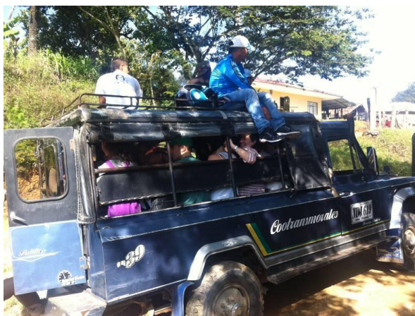
Euskal Ordezkaritza Morales udalerritik La Salvajinara eramatea

2012ko urriaren 23an, Hondurasko eta Cerro Tijerasko kabildoetako gobernatzaleek eta buruzagi tradizionalak babes-ekintza bat aurkeztu zuten, Konstituzio Politikoaren 86. artikuluan eta 1991ko 2591 Dekretuan oinarrituta, honako eragile hauen aurka: Errepublikako Presidentetza, Barne Ministerioa, Hezkuntza Nazionaleko Ministerioa, Caucako Gobernuak, Caucako Departamenduaren Hezkuntza Idazkaritza, CVCa eta Union Fenosa,