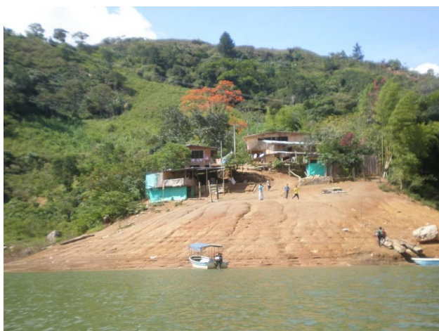
La Salvajina urtegiaren ertzeko etxebizitzak (Morales, Cauca)

kaltetu ziren nekazarien eta indigenen komunitateen ordezkariekin hartutako konpromisoen aktan", Administrazio Publikoaren eta CVCKren konpromisoak biltzen dira; besteak beste, honako hauen gainean: osasuna; zerbitzu publikoak; argindarra; telefonia; ekoizpena eta lana; meatzaritza, arrantza eta basoberritzea; komunikabideak eta garraioibideak; Suarezko lan-publikoak; eta kontu indigenak.