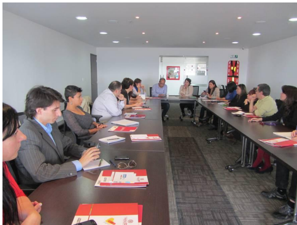
Bilera, Biktimei Arreta eta Laguntza Emateko Unitatearekin

Gainera, lurraldera itzultzea erabaki dutenei lagundu egiten zaie —dela Kolonbian bertan, dela Kolonbiatik kanpo (Kolonbiatik kanpo, 395.000 pertsona errefuxiatuta daudela kalkulatu du Acnur-ek)—, betiere bi printzipioen arabera: segurtasuna eta borondatea.