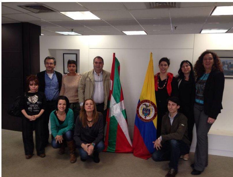
Euskal Ordezkaritza, Eusko Jaurlaritzaren Kolonbiako ordezkariaren bulegoetan (Bogota).

Eta, azpimarratu du Kolonbiako komunitateek eta gizarte-mugimenduek ausardia eta duintasuna erakutsi dutela indarkeriarik gabeko erresistentzia-proposamenak eginda eta, egunero, erakunde armatuen tiroen erdian, bizikidetzarako eremuak eraikitzearen alde eginda.