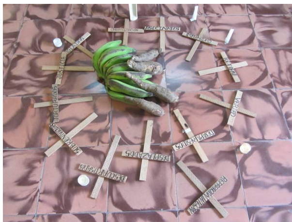
Bilera, Justiziaren eta Bakearen Aldeko Eliz Arteko Batzordeak lagundutako prozesuekin (Popayan, Cauca)

CIJP Kolonbiako 32 departamenduetatik zortzitan dago. Laguntzen dituen prozesu eta komunitateen artean daude, besteak beste: Justizia Jauregitik desagertutako pertsonen familiakideak; Cacarcatik ihes egindako familiak - Cavidaren Autodeterminazioaren, Bizitzaren eta Ohorearen Komunitatea; Bajo Atratoko (Cacarica, Curvarado eta Jiguamiando), Perla Amazonikako (Putumayo) eta Bajo Calima arroko (Buenaventura udalerria) prozesu komunitarioak.