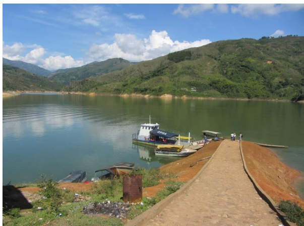
La Salvajina gurutzatzeko txalupetako bat (Morales, Cauca)

inkomunikazio-egoera dela urtegia zeharkatzeko garraio eskasiagatik, dela Morales udalerritik Hondurasko Babeslekura arte iristeko bideen egoeragatik.